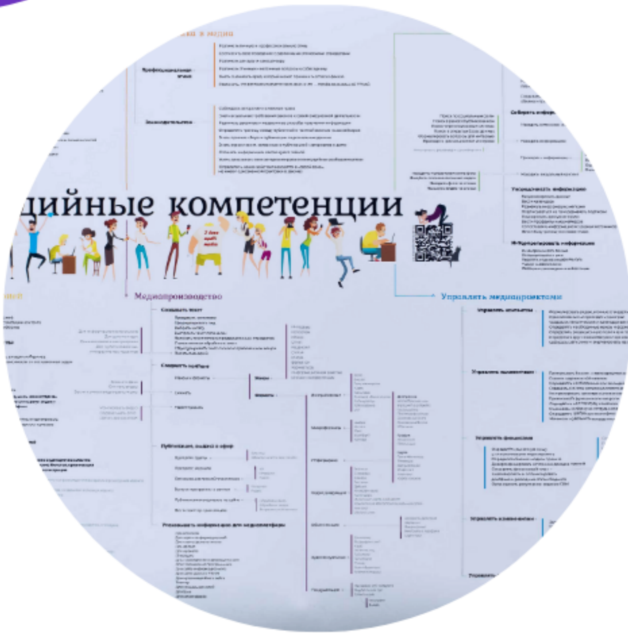
Карта медийных компетенций